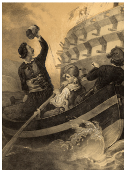
Ο Τομπάζης πυρπολεί το πρώτο τουρκικό δίκροτο στην Ερεσό (8 Ιουνίου 1821). Λιθογραφία του Peter von Hess, Μόναχο, 1852.

Είναι αδύνατον να κατανοήσουμε τον Πόλεμο της Ανεξαρτησίας χωρίς προηγουμένως να λάβουμε υπόψη μας το περιβάλλον μέσα στο οποίο γεννιέται. Και όμως οι περισσότερες μελέτες ξεκινούν από την αφετηρία ότι η κοινότητα των Ρωμιών αναδεικνύεται μέσα από τα γράμματα και το εμπόριο σε μία αυτοκρατορία που παρακαμάζει. Στην παρουσίασή μου θα επιμείνω σε μία διαφορετική οπτική: η ελληνικός πόλεμος της Ανεξαρτησίας είναι το παράπλευρο προϊόν των μετασχηματισμών που γνωρίζει από τα τέλη του 17ου και τις αρχές του 18ου αιώνα η Οθωμανική αυτοκρατορία στην προσπάθειά της να επιβιώσει στον διεθνή κρατικό ανταγωνισμό.