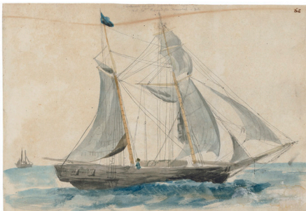
Σκούνα Κεφαλλονίτη καπετάνιο που εμπορεύεται στην Κωνσταντινούπολη. Μελάνι και υδατογραφία σε χαρτί του Γεράσιμου Πιτζαμάνου, 1818/1820.

Στα ερωτήματα αυτά επιχειρεί να απαντήσει η εισήγηση, ξεκινώντας από τα ίδια τα συνταγματικά κείμενα και προχωρώντας στην εφαρμογή και τη μη εφαρμογή τους στην πράξη.