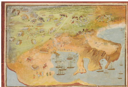
Ναυμαχία Πειραιώς και Φαληρέως. Παναγιώτη Ζωγράφου, Εικόνες του Αγώνα της Ανεξαρτησίας κατά στοχασμόν Ιωάννη Μακρυγιάννη . Τέμπερα σε ξύλο, 1836-1839.

Οι μάχες της ξηράς έπαιξαν καθοριστικό ρόλο στην Επανάσταση του 1821, έστω και αν το πολυτιμότερο όπλο του Αγώνα θεωρούνταν ο στόλος του. Καθοριστικής σημασίας μάχες και πολιορκίες ήταν εκείνες της Τριπολιτσάς (Σεπτέμβριος 1821), του Πέτα και των Δερβενακίων (Ιούλιος 1822), του Μεσολογγίου (Οκτώβριος-Δεκέμβριος 1822 και Απρίλιος 1825-Απρίλιος 1826), των Μύλων (Ιούνιος 1825), της Αθήνας (Απρίλιος 1827), της Πέτρας (Σεπτέμβριος 1829). Η έκβαση των μαχών αυτών έπαιξε ρόλο και σε ένα άλλο σκέλος των πραγμάτων, εκείνο του σχηματισμού ή όχι τακτικού ελληνικού στρατού. Η παράμετρος αυτή, με τη σειρά της, επηρέασε καίρια τα πολιτικά πράγματα, τις εσωτερικές ισορροπίες και την έκβαση του Αγώνα.