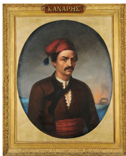
Ο Κωνσταντίνος Κανάρης. Προσωπογραφία αγνώστου καλλιτέχνη.

Στην ομιλία θα παρουσιαστούν αθηναϊκά έργα ζωγραφικής, γλυπτικής και χαρακτηριστικής που σχετίζονται με πρόσωπα και γεγονότα της Επανάστασης του 1821. Πρόκειται για προσωπογραφίες ηρώων και παραστάσεις μαχών. Μέσα από τη μελέτη των συγκεκριμένων εικαστικών συνθέσεων, θα επιχειρηθεί να φωτιστούν τόσο η γενικότερη παιδεία των καλλιτεχνών -γηγενών και αλλοδαπών- του 19ου, του 20ού αλλά και του 21ου αιώνα που τις έχουν φιλοτενήσει όσο και τα πρότυπα που εκείνοι έχουν επιλέξει, δηλαδή οι εικονογραφικοί τύποι τους. Στις προθέσεις του ομιλητή περιλαμβάνονται η επαναξιολόγηση των πραγματολογικών δεδομένων που αποτυπώνουν τα έργα, η ανίχνευση επιρροών των δημιουργών τους, ο βαθμός σύγκλισης/απόκλισης στην κλίμακα δημόσιας και ιδιωτικής σφαίρας ως προς την παραγγελιοδοσία, η υποδοχή των έργων από την τεχνοκριτική στον ημερήσιο και τον περιοδικό Τύπο, η πρόκληση γόνιμου προβληματισμού και η εξαγωγή των ανάλογων συμπερασμάτων.